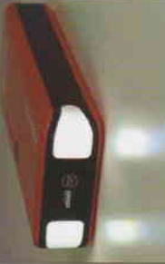
POWER LED LIGHTS